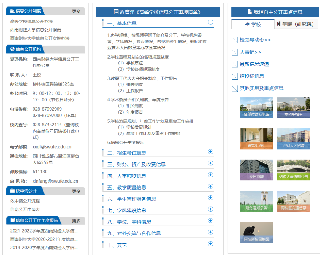
图 2 西南财经大学信息公开专题网站