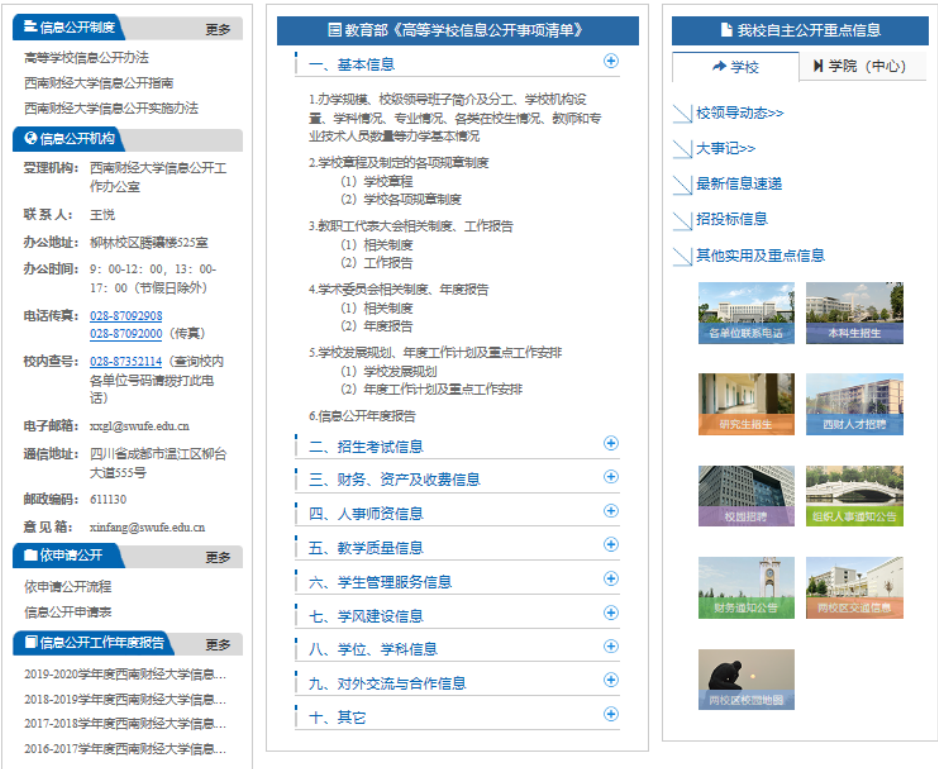
图 2 西南财经大学信息公开网站

我校基本信息在学校信息公开网站公开，同时也通过学校官网及二级单位官方网站等多种其他渠道进行公开。