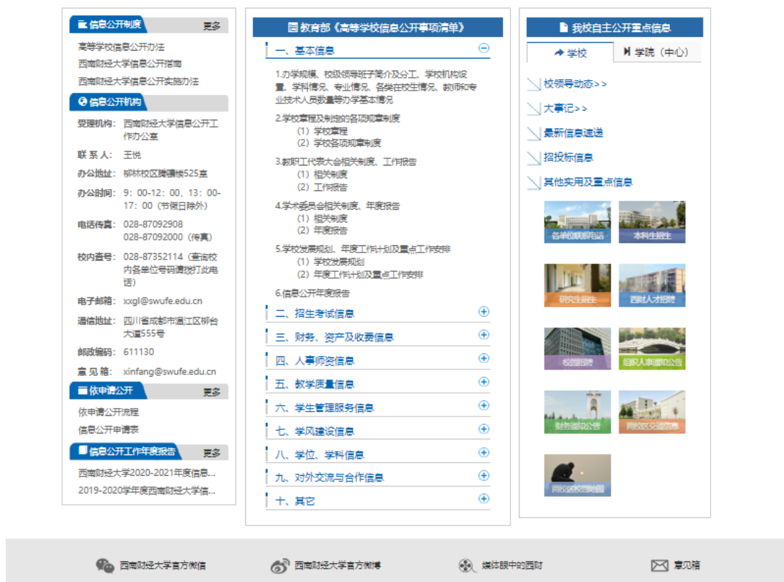
图2 西南财经大学信息公开专题网站

学校信息公开的渠道还包括：学校本科招生网，研究生招生网，财务管理系统，各二级单位官方网站、公众号、微博，校内广播、电视，学校信息布告栏，电子显示屏等。